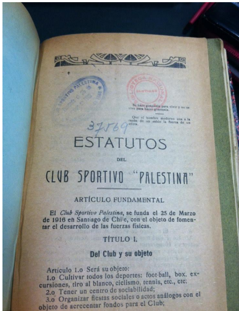
Figura 4. Estatutos del Club Sportivo Palestina.

En la Biblioteca Nacional de Santiago, se encuentran unos estatutos de la conformación del “Club Sportivo Palestina”, con fecha marzo de 1916 en Santiago de Chile. Los cuales dan cuenta que la fundación del club es con tiempo anterior al oficial.