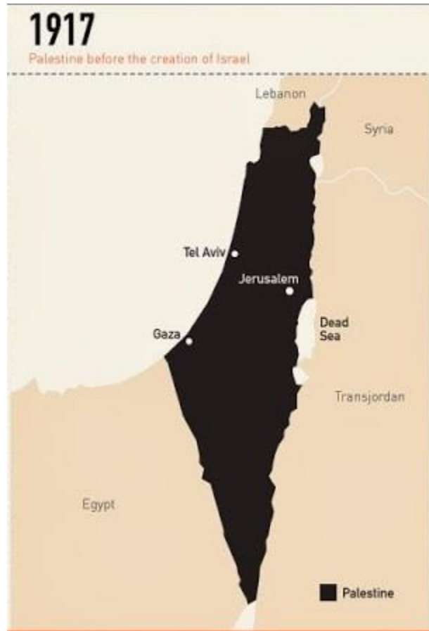
Figura 1. Mapa de Palestina hacia 1917, con anterioridad a la creación del Estado de Israel.