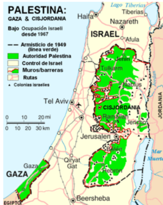
Figura 2. Mapa de Palestina bajo la ocupación desde 1947.

el territorio inicialmente previsto por las Naciones Unidas para un Estado árabe se redujo a la mitad (BBC Mundo, 2014).